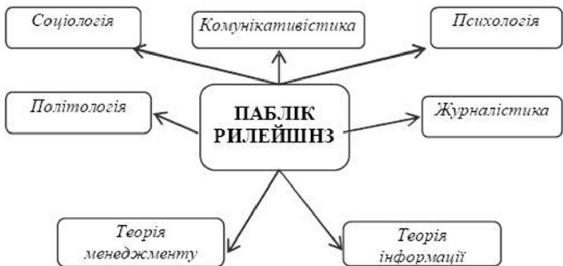
Рисунок 1.2 – Паблік рилейшнз і споріднена з ним діяльність