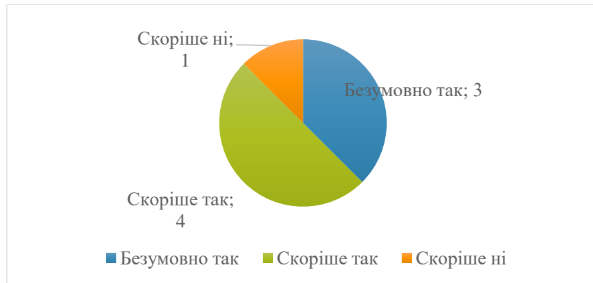
Рис. 2. Розподіл відповідей на питання «Якби Вам знову довелося вирішувати питання про вибір ЗВО для навчання та спеціальності, Ви б обрали сьогодні Вашу освітню програму / спеціальність?», n=8, осіб

Опитані поставили оцінку 9 якості викладання за 10-ти бальною шкалою. Також більшість відзначила, що під час навчання вони мали можливість повною мірою або частково обирати навчальні дисципліни під час навчання (7 випускників), долучатися до наукових досліджень кафедр та викладачів (7 випускників), брати участь в програмах міжнародної академічної мобільності (6 випускників). Безпосередньо брали участь в програмах міжнародної академічної мобільності 2 випускника.