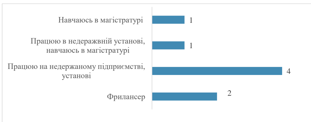
Рис. 4. Розподіл відповідей на питання «Яке Ваше основне заняття в даний час?», n=8, осіб

Серед 6 випускників, які працюють зараз, 4 працюють не за фахом. 3 випускники зазначили, що вони є спеціалістами гуманітарного профілю, а 1 – керівником підрозділу/відділу в організації.