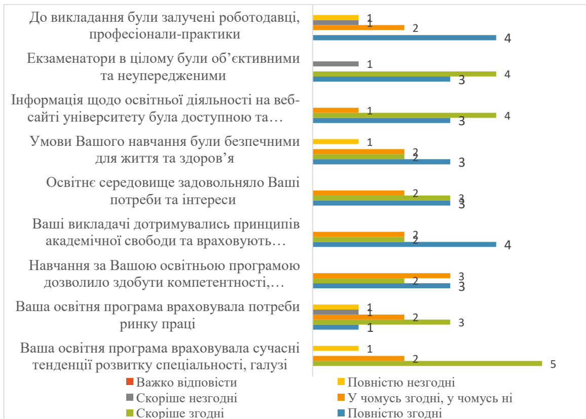
Рис. 3. Розподіл відповідей на питання «Якою мірою Ви згодні чи незгодні з наступними твердженнями...», n=8, осіб

Загалом, випускники схарактеризували освітню програму як таку, що враховує тенденції розвитку спеціальності, ринку праці тощо.