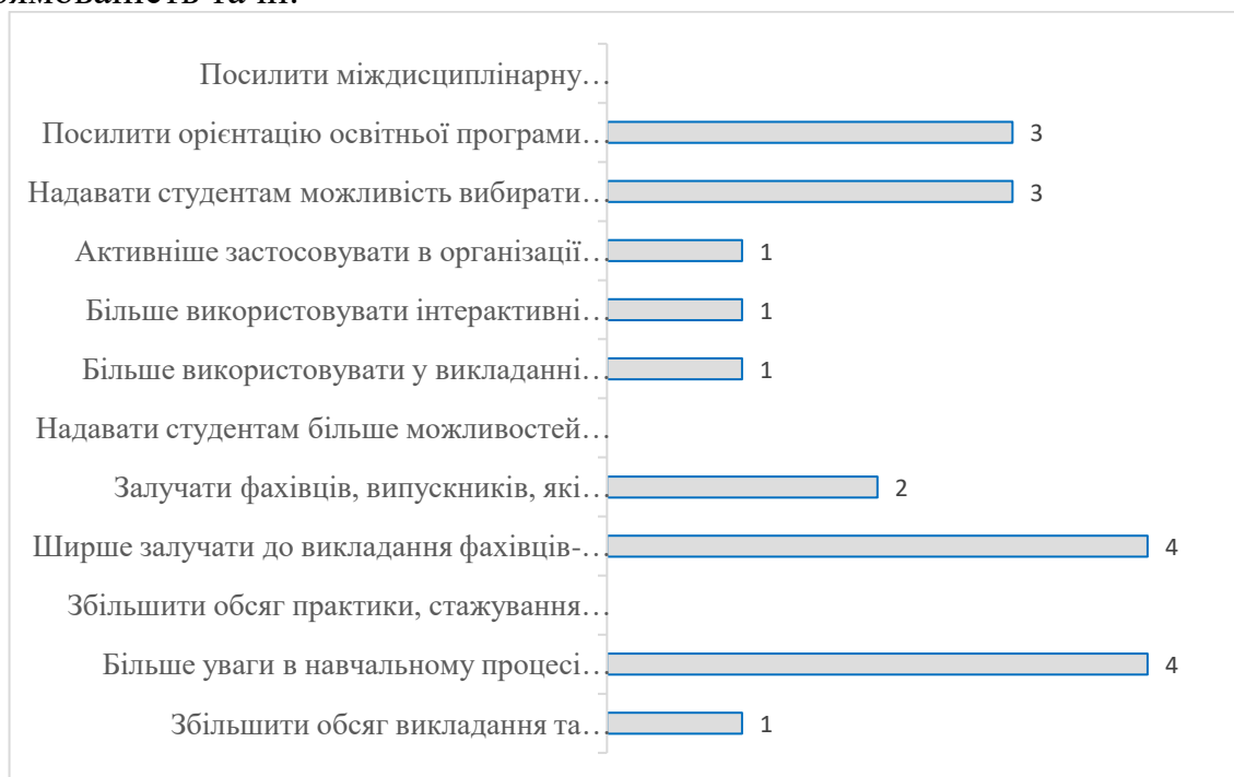
Рис. 4. Розподіл відповідей на питання «Як Ви вважаєте, що необхідно змінити у змісті освітньої програми для підвищення конкурентоспроможності випускників Каразинського університету на ринку праці?», n=7, осіб

Водночас викладачі наголошують на необхідності подальшого посилення практичної орієнтації освітньої програми, пропонують більше уваги приділяти практичним заняттям та ширше залучати практиків, посилити орієнтацію програми на міжнародний ринок праці та її міждисциплінарну спрямованість та ін.