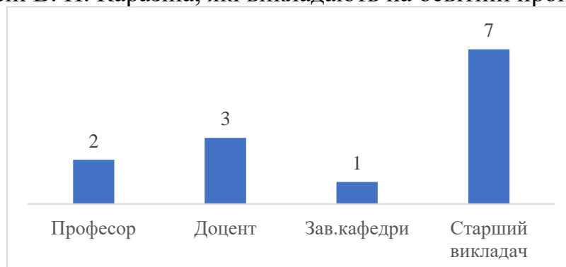
Рис. 1. Розподіл відповідей на питання «Ваша основна посада в університеті?», n=7, осіб

Характеристика респондентів. В опитуванні взяли участь викладачі соціологічного та філософського факультетів Харківського національного університету імені В. Н. Каразіна, які викладають на освітній програмі.