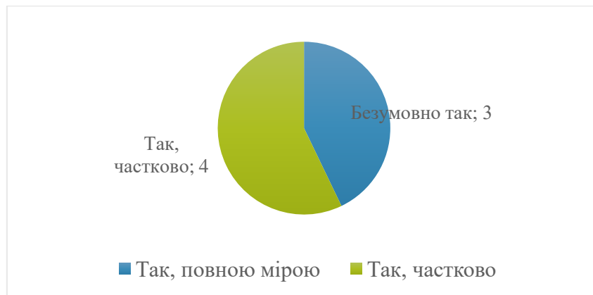
Рис. 3. Розподіл відповідей на питання «Чи мають студенти можливість залучатись до наукових досліджень?», n=7, осіб

Загальна оцінка освітньої програми. Всі викладачі позитивно оцінюють освітню програму, вважають її такою, що відповідає потребам ринку праці, дозволяє сформувати необхідні професійні компетентності та враховує сучасні тенденції розвитку спеціальності.